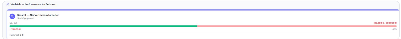
Vertriebsperformance — Soll/Ist-Balken mit automatischer Provisionsberechnung pro Mitarbeiter

Nexflow zeigt Soll/Ist-Performance pro Vertriebsmitarbeiter und visualisiert Umsätze nach Herkunftsland in Echtzeit.